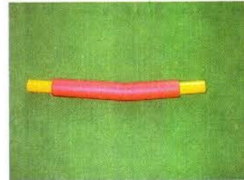
СТОЙКА (1 ШТ.)