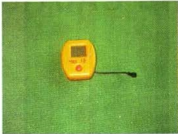
КОНСОЛЬ (1 ШТ.)