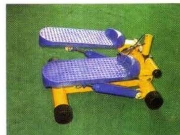
ОСНОВАНИЕ (1 ШТ.)