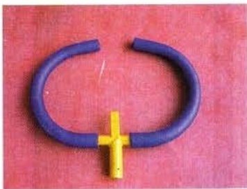
ПОРУЧЕНЬ (1 ШТ.)